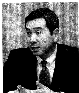
福本 俊 1951年10月生まれ、57歳。75年3月東京大学法学部卒業。同年4月運輸省(当時)入省。95年6月7月自動車交通局長に就任。2007年7月国土交通省運輸局長に就任。2008年7月国土交通省運輸局長に就任。

国土交通省は、二〇〇七年は死者数が五十年ぶりに五千人を超え、〇八年は五千人を大幅に超え、一万人を突破した。一方、トラック・バス・タクシーの事業用車両の減少傾向は鈍く、国土交通省は「今後十年間に事故死者数を半減」として「二八」死者削減目標を打ち出した。運輸事業者は「安全対策を強化して、〇六年度に比べて二八の死者削減目標を達成する」として、ハード・ソフトの両面から対策を講じている。国土交通省は「二八」削減目標を達成するために、ハード・ソフトの両面から対策を講じている。